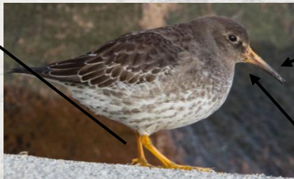
Ron Knight (CC BY 2.0)