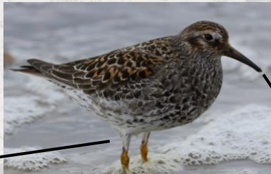
David Genoud (CC BY-NC-SA 2.0)