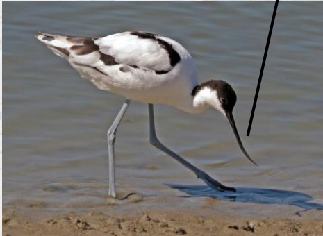
Charles J Sharp (CC BY-SA 4.0)