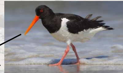
Andreas Trepte (CC BY-SA 2.5)