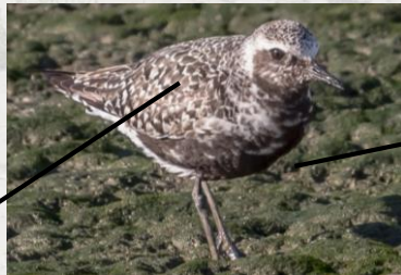
Becky Matsubara (CC BY 2.0)