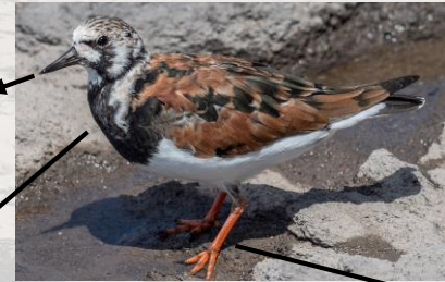
Andrew C (CC BY 2.0)