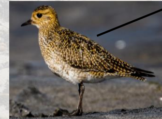
Ómar Runólfsson (CC BY 2.0)