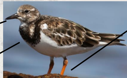
JJ Harrison (CC BY-SA 4.0)